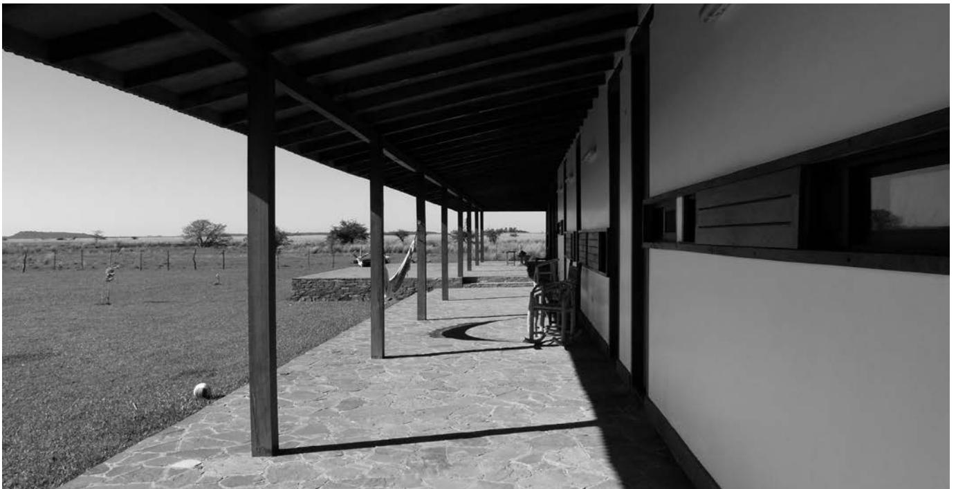
Arriba, pabellón principal. Derecha, habitación de invitados, pabellón principal.